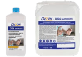
Фасовка: 1 л 5 л