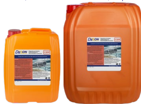
Фасовка: 5 кг 20 кг

Состав: вода, неорганические и органические кислоты, катионные и неионогенные ПАВ, ингибиторы коррозии.