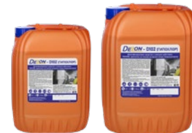
Фасовка: 12 кг 24 кг