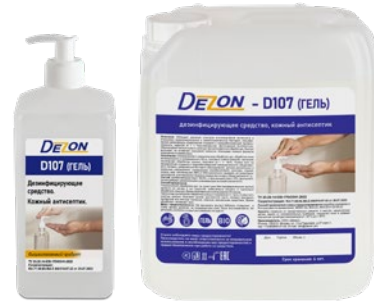
Фасовка: 1 л насос 5 л

Состав: изопропиловый спирт – 60,0%, и-пропиловый спирт – 10%, функциональные добавки, увлажняющие и ухаживающие за кожей компоненты.