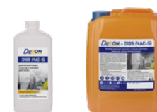
Фасовка: 1 кг 5 кг

Состав: алкилдиметилбензиламоний хлорид - 5,0%, щелочные компоненты, неионогенные поверхностно-активные вещества, обеспечивающие моющее и обезжиривающее действие, ингибитор коррозии и другие функциональные компоненты.