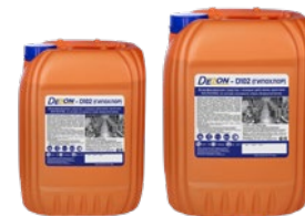
Фасовка: 12 кг 24 кг