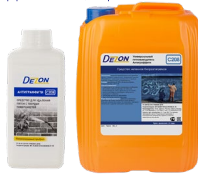
Фасовка: 1 кг 5 кг

Состав: неионогенные ПАВ, активные добавки, очищенная вода.