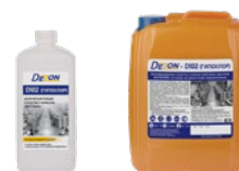
Фасовка: 1 кг 5 кг

Состав: гипохлорит натрия с массовой долей активного хлора - 6,0%, щелочные компоненты, неионогенные поверхностно-активные вещества, обеспечивающих моющее и обезжиривающее действие, ингибитор коррозии, стабилизаторы и другие функциональные компоненты.