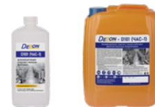
Фасовка: 1 кг 5 кг

Состав: алкилдиметилбензиламоний хлорид - 1,0%, щелочные компоненты, неионогенные поверхностно-активные вещества, обеспечивающих моющее и обезжиривающее действие, ингибитор коррозии и другие функциональные компоненты.