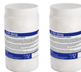
Фасовка: 1 кг 1 кг

Быстродействующие таблетки и гранулы на основе натриевой соли дихлоризоциануровой кислоты. Вес таблетки 3,2 г (содержит 1,5 г активного хлора в каждой таблетке). Средство совместимо с моющими средствами. Подходит для дезинфекции на предприятиях коммунально-бытового обслуживания, на предприятиях общественного питания, в учреждениях образования, культуры, отдыха, спорта, социального обеспечения, пенитенциарных учреждениях, санаторно-курортного хозяйства, детских школьных и дошкольных учреждениях и других организациях в сфере обслуживания населения.