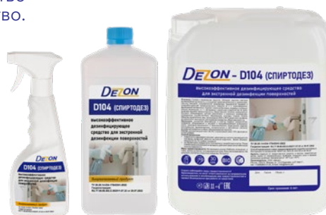
Фасовка: 0,5 кг триггер 1 кг 5 кг

Состав: изопропиловый спирт – 60,0%, н-пропиловый спирт – 10%, а также функциональные добавки.