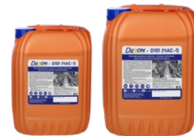
Фасовка: 11 кг 22 кг