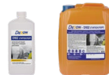
Фасовка: 1 кг 5 кг

Состав: гипохлорит натрия с массовой долей активного хлора - 6,0%, щелочные компоненты, неионогенные поверхностно-активные вещества, обеспечивающие моющее и обезжиривающее действие, ингибитор коррозии, стабилизаторы и другие функциональные компоненты.