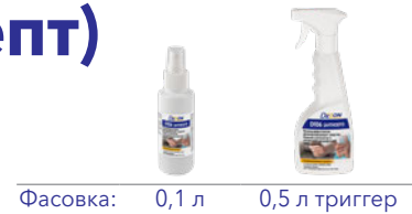
Фасовка: 0,1 л 0,5 л триггер

Состав: изопропиловый спирт – 60,0%, н-пропиловый спирт – 10%, функциональные добавки.