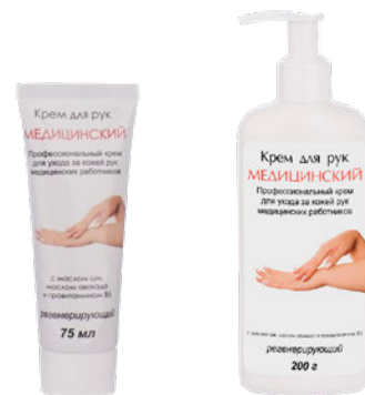
Фасовка: 75 мл 200 г

Состав: вода, масло вазелиновое, моностеарат глицерина, цетеариловый спирт, глицерин, масло растительное, цетеарет- 20, изопропилпальмитат, циклометикон, масло ши, масло авокадо, провитамин B5, витамин E, витамин F, трилон B, парфюмерная композиция, пропиленгликоль, диазолидинил мочевины, йодопропинилбутилкарбамат.