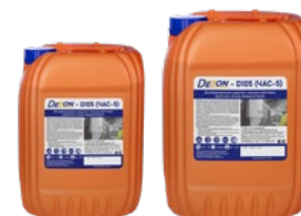
Фасовка: 11 кг 22 кг